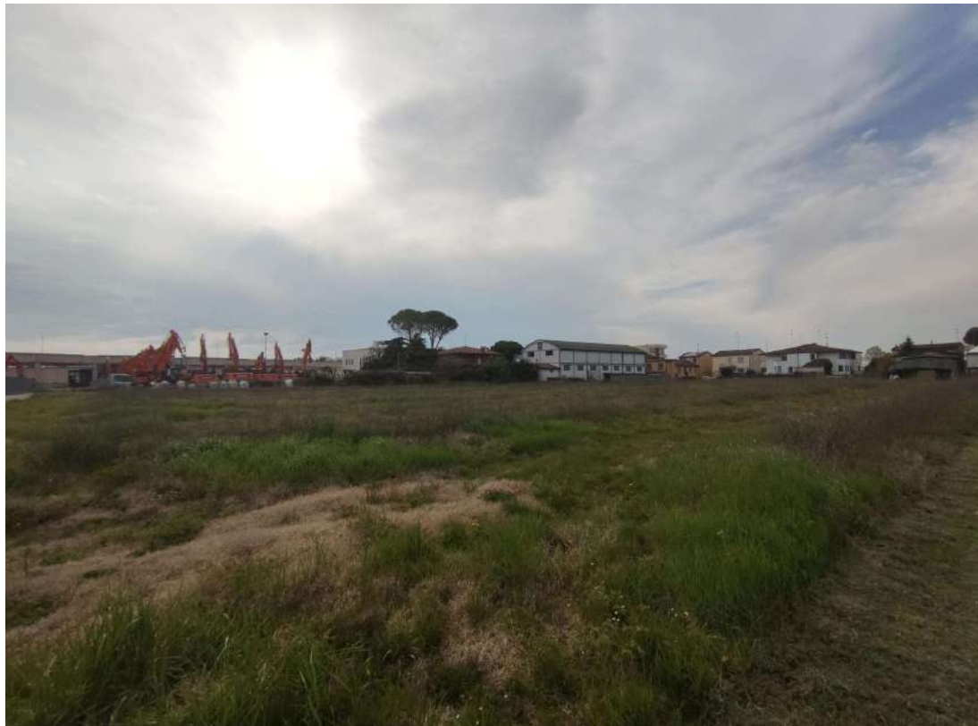
Figura 4 - Vista dell'area di progetto (Punto di vista 3)