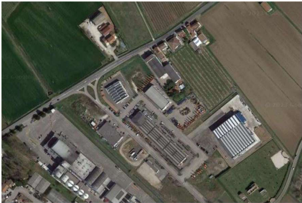
Figura 2 - Vista dall'alto area di progetto