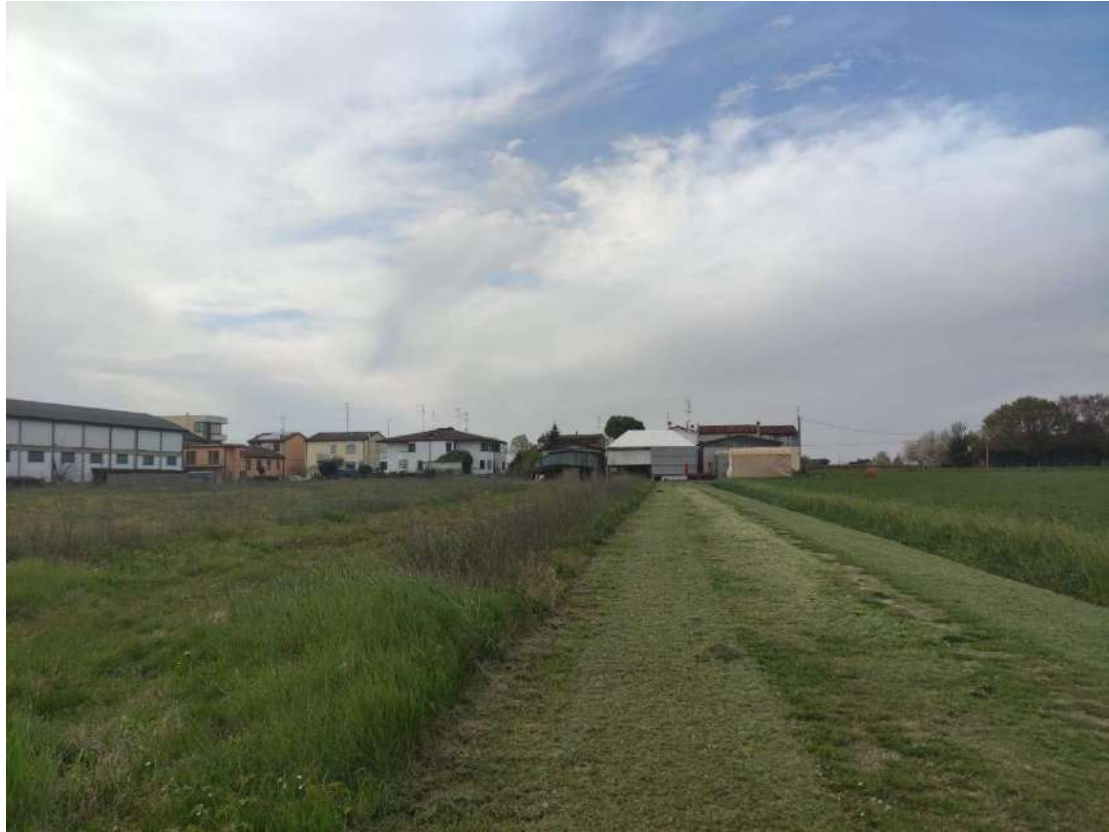
Figura 3 - Vista del fosso limitrofa all'area di progetto (Punto di vista 1)