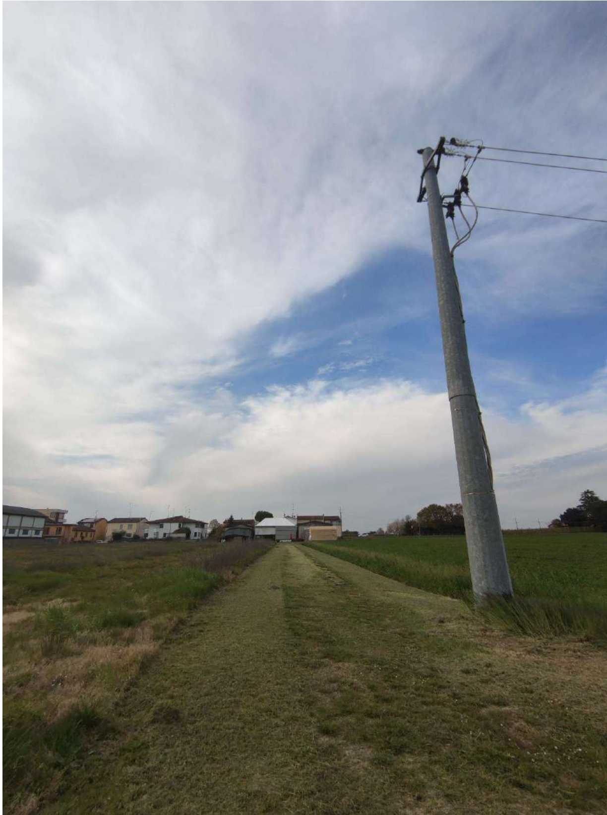
Figura 5 - Vista del fosso dall'angolo del progetto (Punto di vista 2)